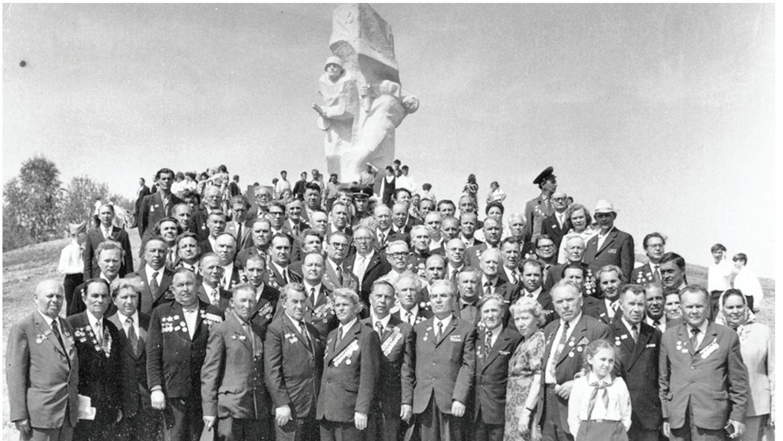
Курсанты в день открытия памятника в Ильинском.

Состав творческой группы, а также имя режиссера будут объявлены позднее. Сценарий будет опираться на архивные материалы, к работе привлечены историки, краеведы и родственники героев войны. Уже в феврале 2018 года должны начаться подготовительные работы, в мае стартуют первые съемки. В сентябре-октяб-